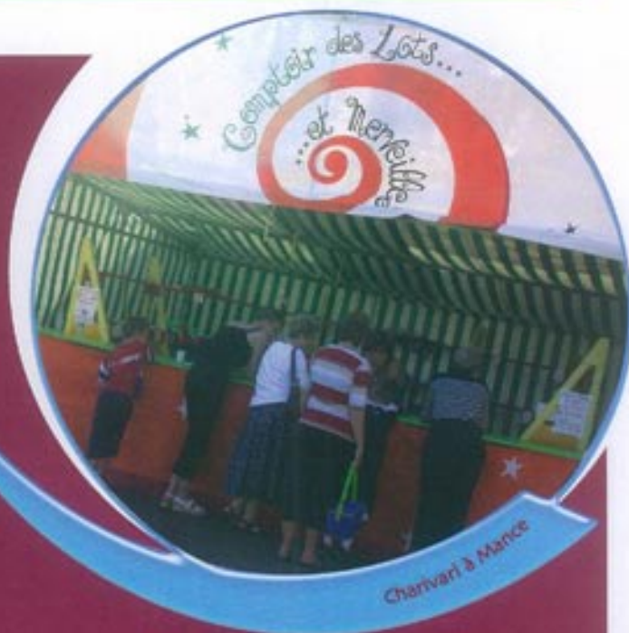
Charivari à Mance

Avec une troupe en résidence durant tout l'été (la compagnie Balagan Balagan) pour préparer l'événement et trois scènes installées autour de l'église et de la mairie, la CCPB n'avait pas lésiné sur les moyens. La petite fête de pays avait même des airs de festival de théâtre. Les spectateurs ont d'ailleurs applaudi la qualité des spectacles présentés.