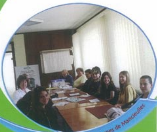
Conseil municipal des jeunes de Mancieulles

Après avoir assisté à une animation dispensée par le Sirtom sur le tri et le respect de l'environnement, le mercredi 1 septembre, ils ont décidé d'entamer une réflexion au niveau de la ville. Comment peut-on faire pour que les gens trient plus et mieux ? Quels sont les gestes qui peuvent préserver l'environnement au quotidien ? Comment éviter les décharges sauvages ? Autant de questions qui leur ont permis de mettre en place un plan d'actions pour mobiliser la population manceulloise. De plus, l'an prochain, ils partiront à la découverte d'un centre de tri et d'une usine de recyclage pour découvrir l'intégralité de la filière du tri.