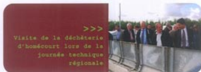
>>> Visite de la déchèterie d'Homécourt lors de la journée technique régionale