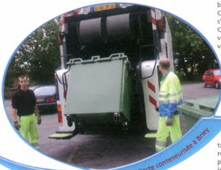
Collecte conteneurisée à Briey

Les communes d'Anderny, Les Baroches, Briey et Ville-sur-Yron ont fait le choix de la conteneurisation. Ce mot, un peu barbare, désigne le fait que chaque habitation de la ville va être dotée d'un bac à ordures ménagères. Il est nécessaire d'insister sur ce terme d'"habitation". Les bacs sont en effet affectés au logement et non pas aux habitants. Ces bacs prennent bien sûr en compte le nombre d'occupants du logement. Cependant, ils ne sont pas la propriété de ces derniers, c'est-à-dire que s'ils déménagent, ils ne peuvent pas prendre le bac avec eux.