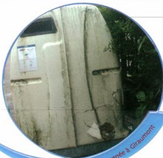
Bulle à papier malmenée à Girumont