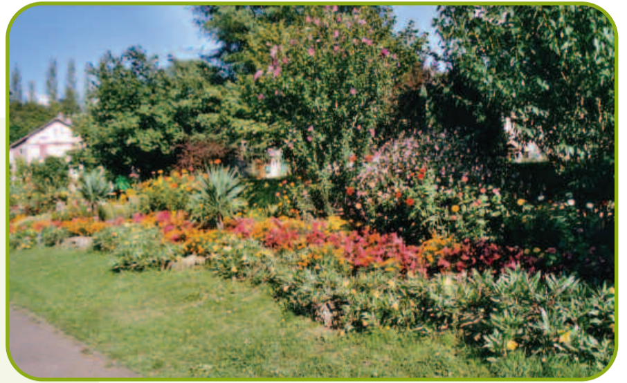
3 ème édition de la journée fleurie

Je trie tous les emballages qui peuvent être valorisés et je composte tous les déchets biodégradables.