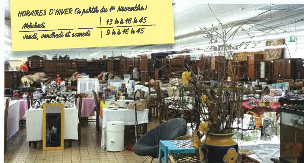
Salle des ventes de l'association Patch à Joeuf