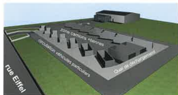
Vue 3D de la nouvelle déchèterie

Pour finir, de par sa situation géographique sur la ZAC de Jarny Girumont, cette nouvelle déchèterie permettra d'offrir de meilleures conditions d'accès.