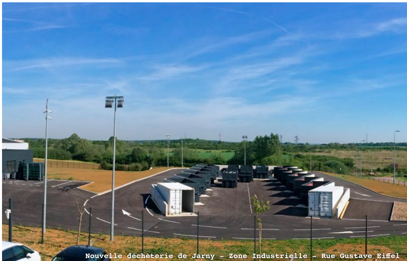
Nouvelle déchèterie de Jarny - Zone Industrielle - Rue Gustave Eiffel